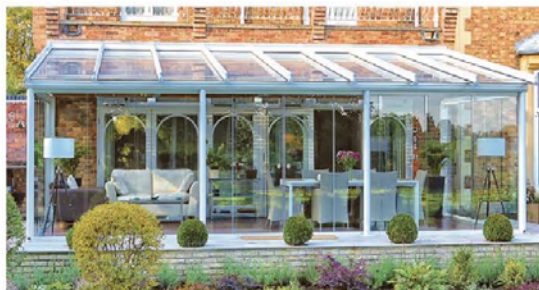
Exemple d'une véranda sans victorienne