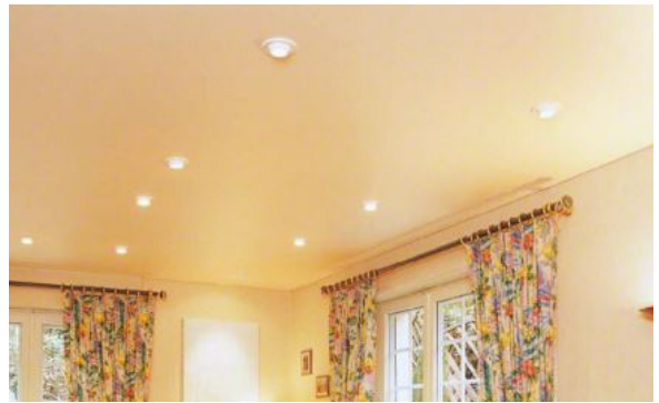
Figure 5 Spots électriques sur plafond rénové