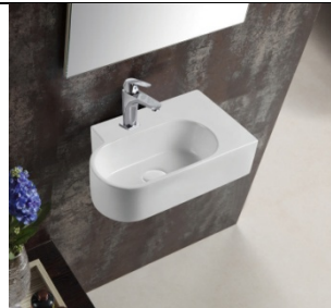
Figure 2 Lavabo sanitaire