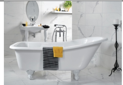
Figure 3 Baignoire sdb rénovée