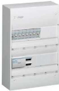
Figure 4 Tableau électrique pour rénovation