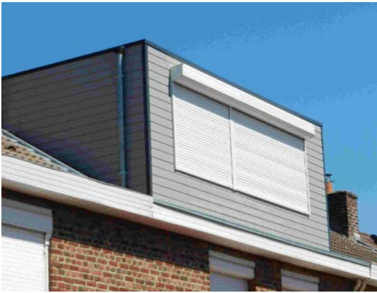
Figure 1 : Lucarne dite "Belle voisine" permettant d'agrandir la maison