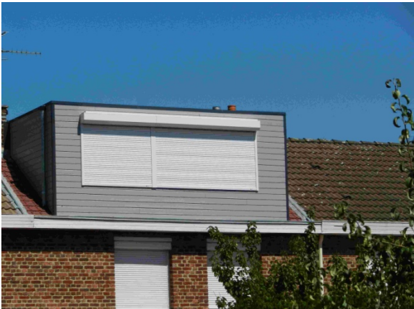
Figure 2 : Extension de maison par création d'une lucarne